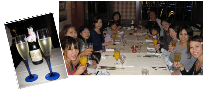
光るカクテルを飲みながら観るマジックショー 帰りにマジックもできるようになっちゃった