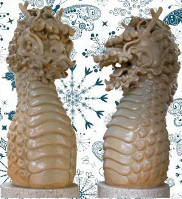
当院、玄関口に設置している龍柱